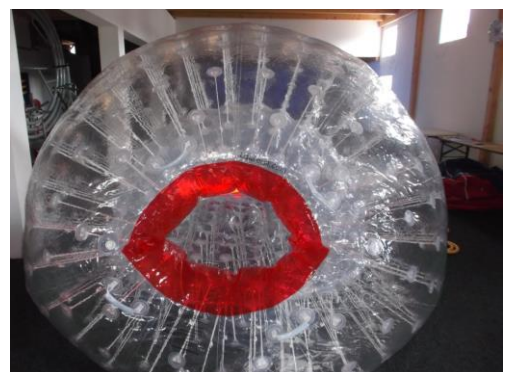
Zwischenstand nach ca. 8 Min.