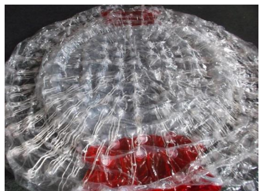
Luft ist vollständig abgesaugt