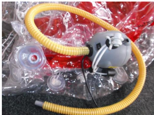
Ventil abdrehen (komplett) und Pumpe anschließen