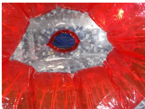
Nach ca. 12 Min.