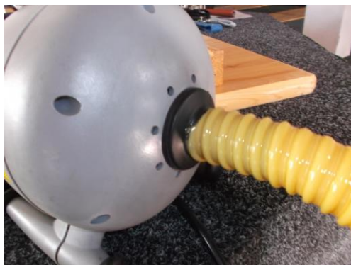
Mit der Pumpe die Luft absaugen