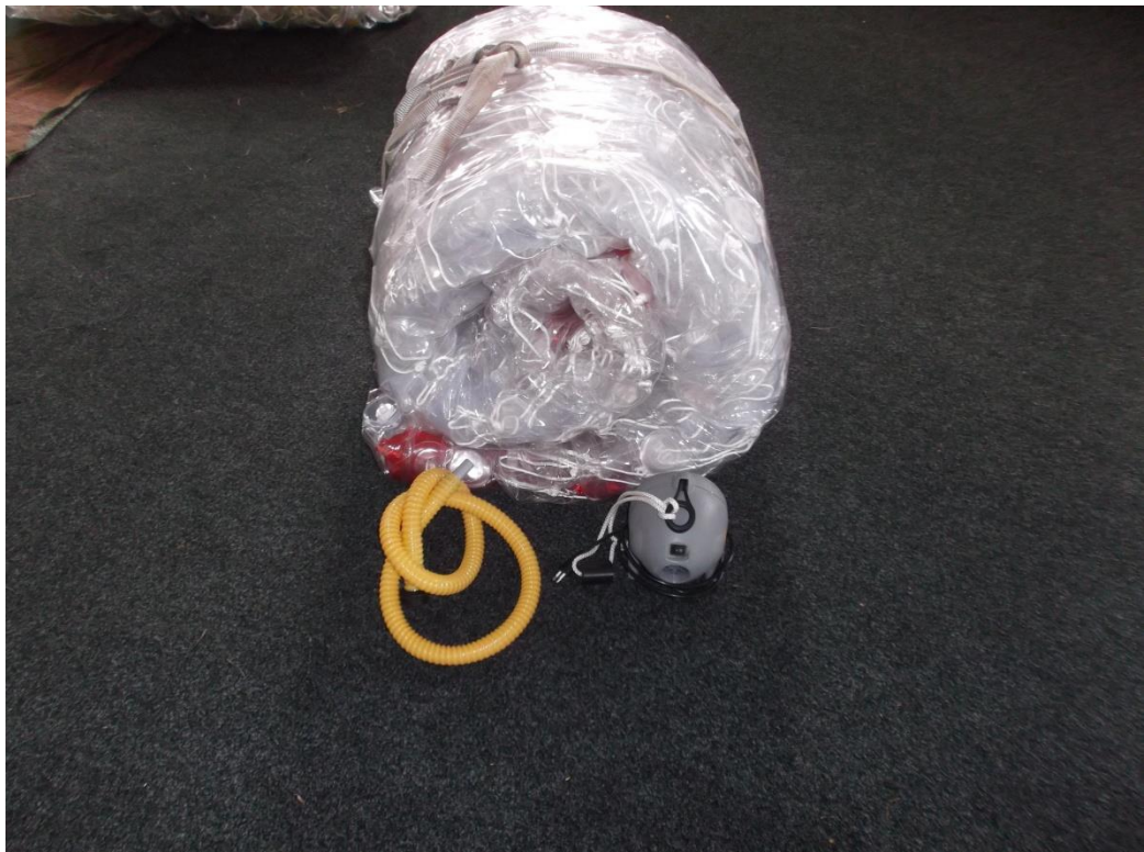
Richtig verpackter MLB