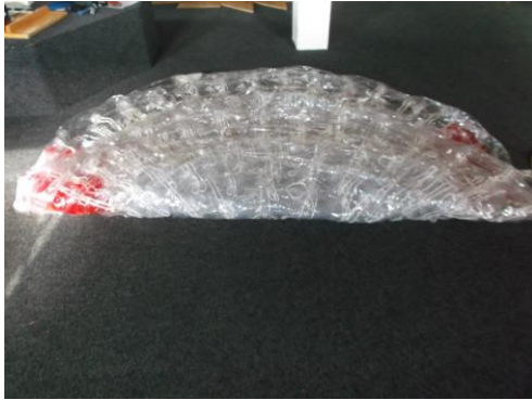
Beide Seiten einschlagen