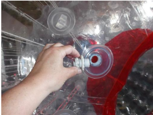
Das Ventil ist vollständig abzdrehen