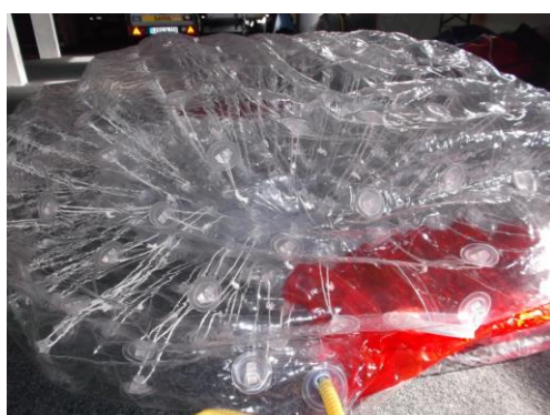
Nach ca. 8 Min.