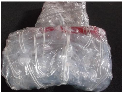
Einrollen des MLB