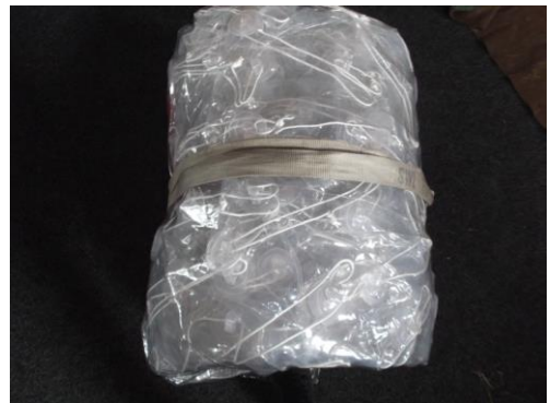
Sichern mit Spanngurt